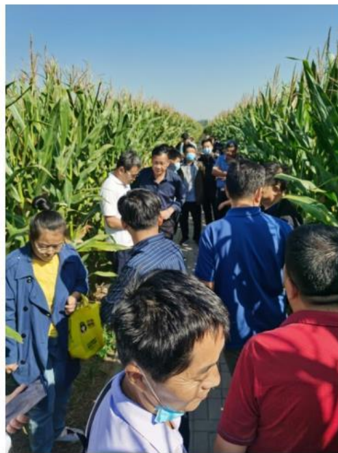
(大豆-玉米复合种植生防示范田)

现场教学环节，学员们先后前往山东德州齐河大豆-玉米复合种植生防示范田、济南槐荫区水稻生防示范田、济南长清区设施蔬菜生防示范田、山东省农科院天敌与授粉昆虫中试生产基地、农业农村部天敌昆虫重点实验室等，实地学习生物防治相关技术，了解生物防治技术科研成果，促进了聆听与思考相结合、理论与实践相印证。本次研修班在保证具有较高专业技术水平的基础上，通过线上全程直播的方式对我国生物防治领域的发展现状、取得成绩等方面进行了很好的科普宣传，受到了学员和受众的一致好评。