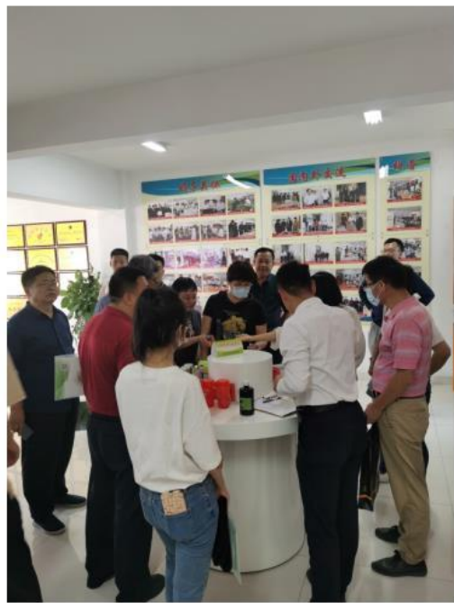
(天敌与授粉昆虫中试生产基地)